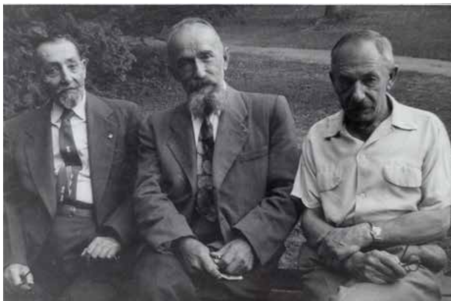
U.S. reunion of St. John's classmates from the Poltava Cadet Corps. (From the Diocesan Archives)

ticulous records. For instance, he issued most official letters and decrees in triplicate (one issue copy, one archival copy and one personal copy)—all this before the age of copy machines. In addition, St. John acquired the knowledge of the exact language needed for legal briefs, protocols and laws. The diocese was ruled by decree, meaning that there were no appeals or discussions of the orders of the ruling hierarch. In St. John's short tenure in the Western American Diocese (1963–1966), approximately three hundred decrees were written and issued (currently, only twenty to twenty-five decrees are issued per year). Many clergy found this bureaucratic style tedious and stressful, leading to problems with their being under St. John's omophorion. However,