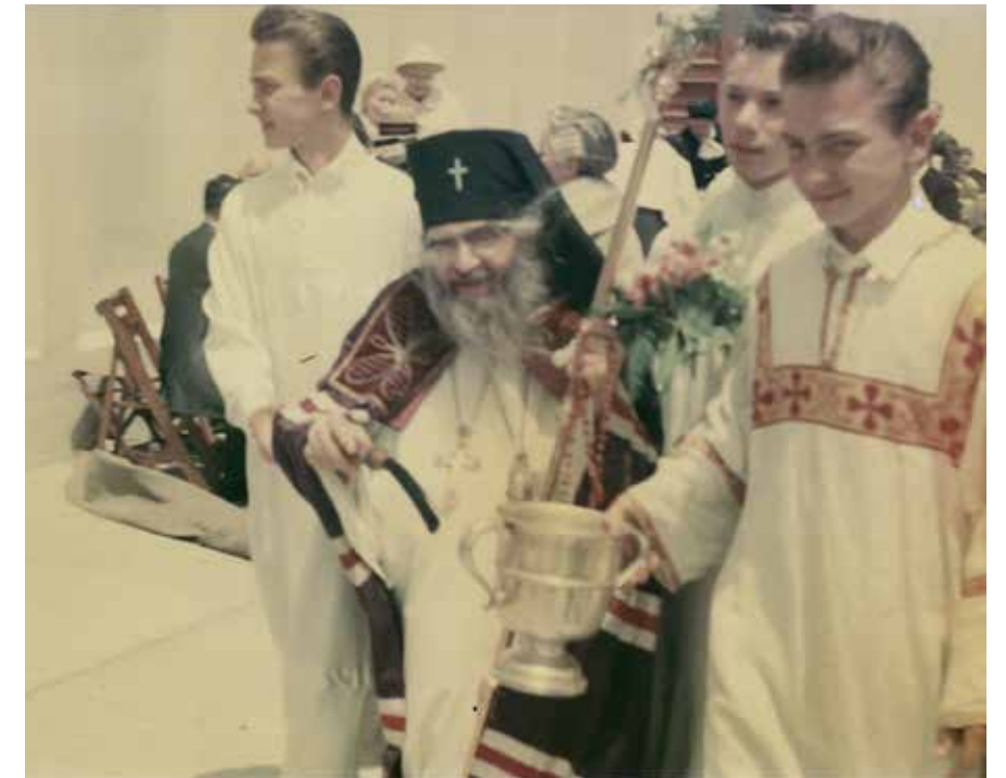
Saint John surrounded by altar boys in San Francisco, 1960s.

St. John lived in that exact moment of history where the outpouring of Grace was most abundant ( where sin abounded, grace did much more abound, Rom. 5:20 ). Not since the persecutions of the early Church had so many saints inhabited the earth at one time: St. Tikhon Patriarch of Moscow, St. Vladimir of Kiev, St. Peter of Kru-