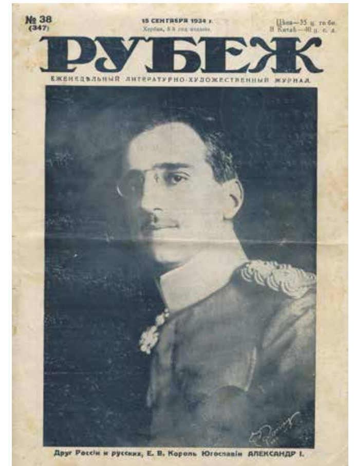
Russian magazine published in Harbin in the 1930s with a cover photo of His Majesty Alexander I Karageorgevich, King of Yugoslavia, on the cover. The caption under the photo reads: "A friend of Russia and Russians, H.I.H. King of Yugoslavia, Alexander I." He was assassinated in 1934 in Marseilles, France. During his tenure as Bishop of Western Europe, Saint John served a panikhida at the place of the King's assassination.

Following graduation from the Cadet Corps in 1914, St. John went on to study jurisprudence at Kharkov University, graduating in 1918, before moving to Belgrade with his family, where he went on to study theology. One aspect of learning jurisprudence then (as it is now) was acquiring knowledge through collection of meticulous records. St. John learned this lesson well. Throughout his life (and especially in his episcopacy), he kept me-