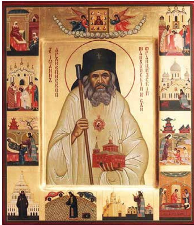
Icon with scenes from the life of St. John, painted by Viktor Kazanin for the Cathedral of St. John the Baptist, Washington, D.C. It is the only Orthodox icon which has an image of the U.S. Capitol.

+Кирилл, Архиепископ Сан-Францисский и Западно-Американский